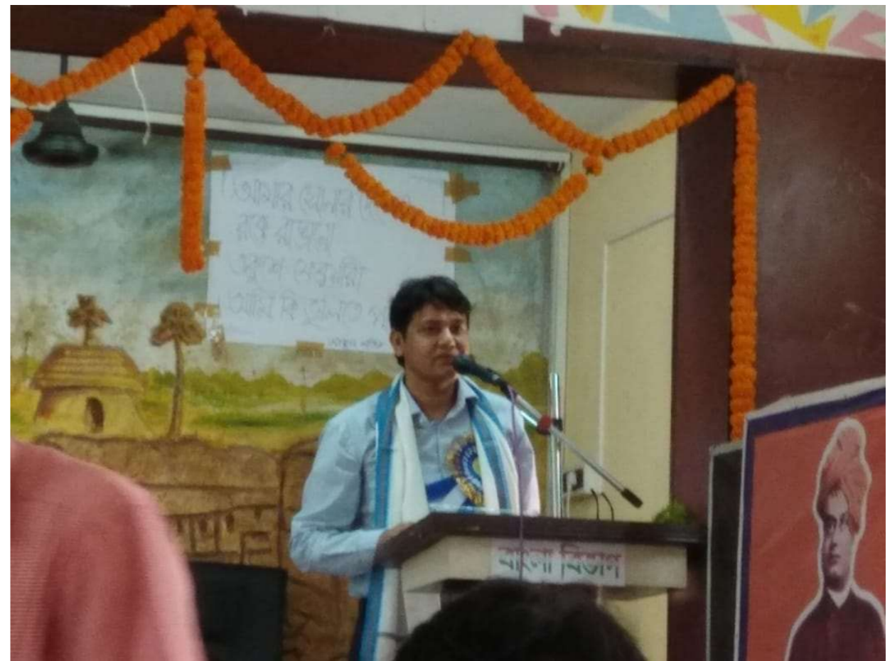
Speech delivered by resource persons